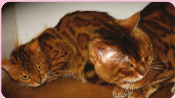
Peppa (izquierda) en la casa del criador en el cubículo con el gato macho

Peppa, una gata de raza bengalí de cinco meses, se compró a un criador en cuyas instalaciones había sido alojada en un cubículo con un macho para que tuviera crías, pero ella se había mostrado demasiado "tímida". La nueva dueña de Peppa notó que su nueva gata no se comportaba como ella esperaba. Buscó la ayuda de un especialista en comportamiento animal y quedó claro que Peppa no había tenido las experiencias tempranas necesarias para vivir de forma adecuada como mascota en una casa y que necesitaba un hogar al aire libre. Battersea Dogs and Cats Home (una organización de acogida animal) dispuso que Peppa formara parte de su programa "Outlet", que organiza "estilos de vida alternativos" para gatos intermedios. Se encontró una granja para ella y un voluntario de la organización le construyó un refugio, otro cubículo pequeño y una zona segura para mantener a los gansos y otros animales fuera. Después de adaptarse a su nuevo hogar, podría moverse por toda la granja.