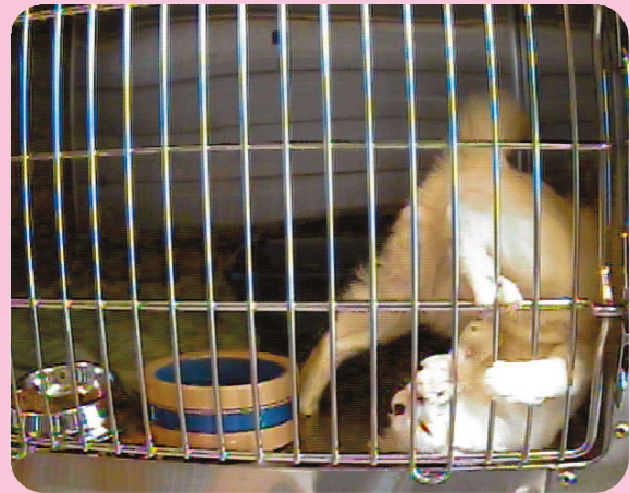
Algunos gatos intermedios pueden frustrarse mucho al estar enjaulados.