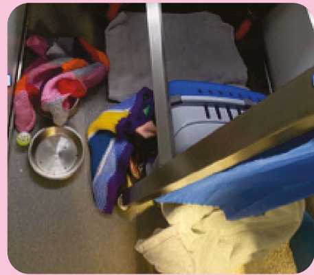
El suelo de un espacio para gato aparece muy desordenado por la mañana

Cuando no existe información sobre su pasado que sugiera que un gato es intermedio, pero el gato se muestra angustiado al estar confinado, se recomienda llevar al animal a una casa de acogida para ver cómo se comporta en un entorno doméstico normal. Por otra parte, si no se tienen pruebas que sugieran que se trata de un gato intermedio, pero el animal parece relativamente cómodo con personas y estando confinado, puede que hubiera otros factores estresantes para el gato en esa casa en particular que influyeron negativamente en su comportamiento. En este caso, encontrar un hogar que sea muy diferente puede permitir que el gato manifieste su verdadera personalidad plenamente.