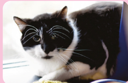
Ejemplos de posturas de gatos que indican que tienen miedo y no están cómodos con su entorno