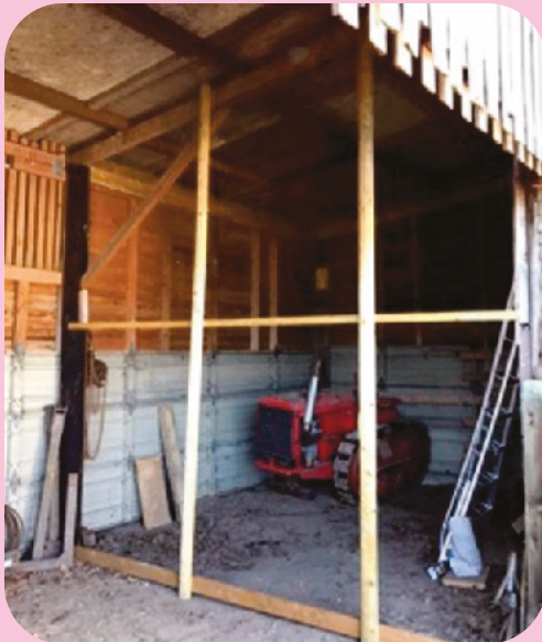
Nuevo recinto en el granero

Se instalaron cámaras de videovigilancia en el granero y se vio que se acicalaba, exploraba y comía bien. Después de varios días se escapó del granero, pero volvió a usarlo como base para llevar un estilo de vida al aire libre con apoyo continuo.