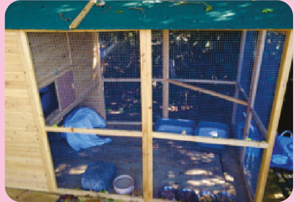
Un refugio construido como vivienda para gatos

No todos los gatos intermedios serán idóneos para vivir un estilo de vida alternativo al aire libre. Aunque es mejor juzgar este aspecto caso por caso, los gatos que posiblemente estarían excluidos son: