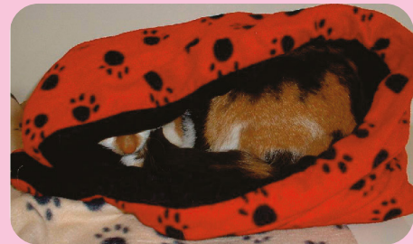
Este gato está escondido dentro de una cama en su cubículo o espacio