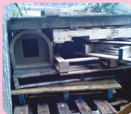
El cubículo de Peppa en la granja