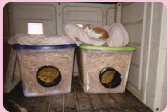
Refugio y escondite en un cobertizo