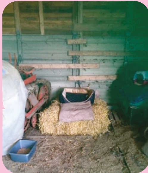
Instalaciones facilitadas en el granero