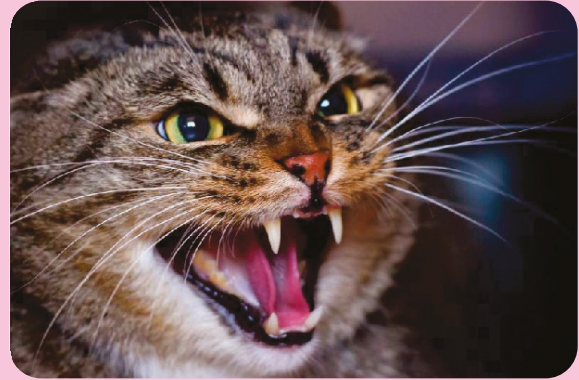
El gato araña, muerde, bufa o gruñe cuando las personas le tocan.