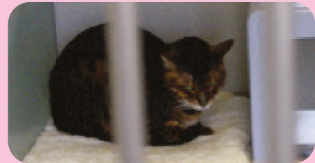
Este gato tiene los hombros encorvados y las patas muy pegadas a su cuerpo con la cola recogida junto a ellas, lo que sugiere que no está cómodo con su entorno.