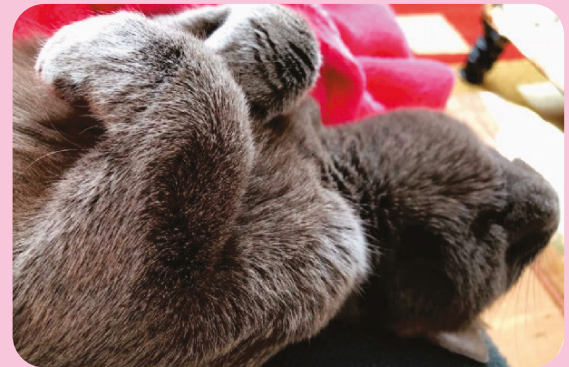
Smokey relajada y disfrutando de la vida en su nuevo hogar